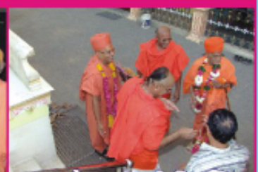
ગઢપુર તાબાના તિર્થધામ કારીયાણીમાં શા.કે.પી.સ્વામી તથા પુ.સ્વા.કૃષ્ણસેવાદાસજીની નિયુક્તિ