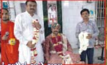
પીઠવડીમાં હરિયાગ નિમિત્તે પ.પુ.વાવણ મહારાજશ્રીનું સામેયું અને સભા