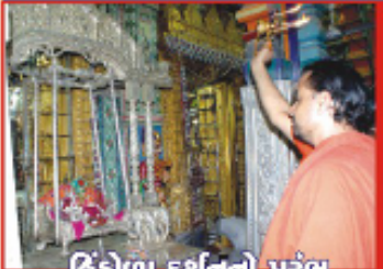
હિંડોળા દર્શનનો પ્રસંગ