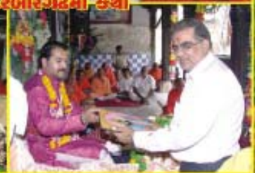
ભાવનગરના હરિભક્તો દ્વારા દરબારગઢમાં ધૂન